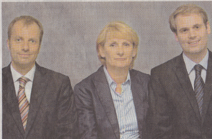
Die heutige Geschäftsleitung der Firma Ufer.